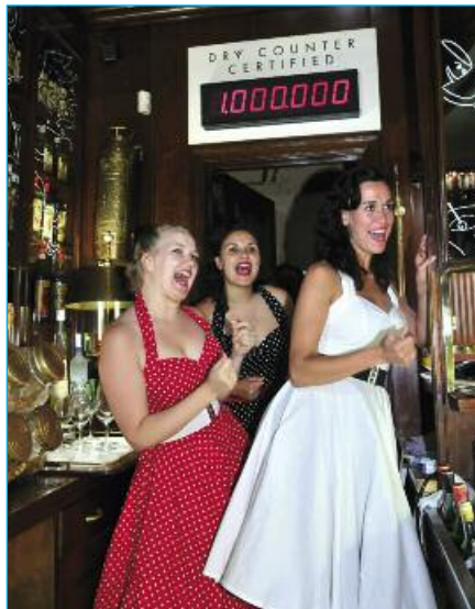
Instante de la fiesta Dry Martini.